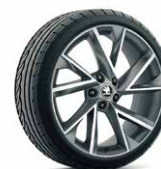
19 吋 VEGA 鋁圈