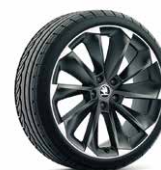
19 吋 SUPERNOVA 鋁圈