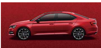
炫彩紅 K1K1 (須加價選購)