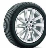
17 吋 STRATOS 鋁圈