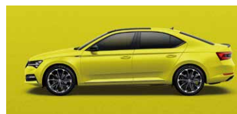
帝王金 9195 (須加價選購)