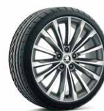
19 吋 TRINITY 鋁圈